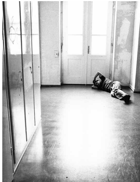
Horazio Guillen Patienten der Anstalt für Epileptische, 1971

Die 1960er- bis 70er-Jahre haben nicht nur die Gesellschaft tief greifend verwandelt. Auch die Fotoausbildung an der damaligen Kunstgewerbeschule Zürich wandte sich mehr als davor der Welt ausserhalb des Studios zu und verliess zunehmend die Tradition der Sach- und Architekturfotografie. Die Studierenden interessierten sich für neue Lehr- und Lebensformen und eine mediale Zeitgenossenschaft. Unter ihnen viele AbsolventInnen der Fotoklasse, die im späteren Beruf als bedeutende FotografInnen, ReporterInnen, Film- und Medienschaaffende in der Schweiz wie international erfolgreich waren und sind. Die Ausstellung zeigt die Highlights jener Jahre: wegweisende Studienarbeiten aus dem Archiv der Zürcher Hochschule der Künste (ZHdK).