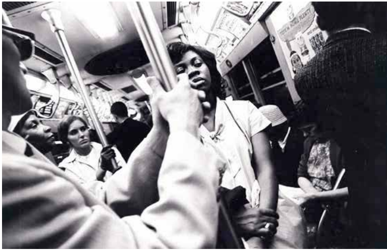
Oliviero Toscani New York, 1964